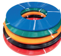
Rollo de difusor de colores ECOXM-12DFX-R Color diffuser reel 30m