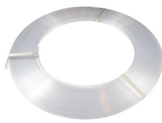
Rollo de difusor transparente ECOXM-12DFC-R Clear diffuser reel 30m