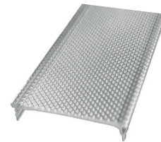
Rollo de difusor rasterizado transparente ECOXM-12DFM-R Clear raster diffuser reel 30m