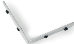
Soporte metálico de montaje para fijar perfiles ECO-X-ES90V-M1 Metal mounting bracket to join profiles