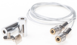
Kit de suspensión (1, 2 ó 3 metros) ECO-X-CORD1 ECO-X-CORD2 ECO-X-CORD3 Suspension kit (1,2 or 3 meters)