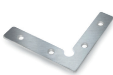
Soporte metálico de montaje para fijar perfiles ECO-X-ES90H-M3 Metal mounting bracket to join profiles