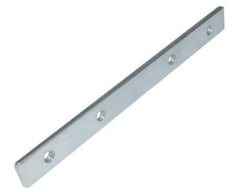
Soporte metálico de montaje para fijar perfiles ECO-X-ES180H-M1 Metal mounting bracket to join profiles