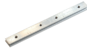
Soporte metálico de montaje para fijar perfiles ECO-ES180H-M2 Metal mounting bracket to join profiles