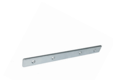
Soporte metálico de montaje para fijar perfiles ECO-ES180H-M1 Metal mounting bracket to join profiles