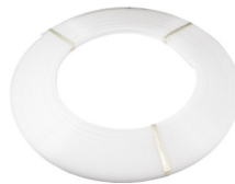
Rollo de difusor opal ECOXM-21DFD-R7 Opal diffuser roll 30m