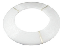
Rollo de difusor opal ECOXM-9DFD-R Opal diffuser roll 30m