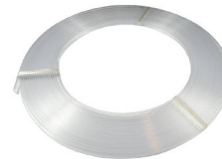
Rollo de difusor transparente ECOXM-9DFC-R Clear diffuser reel 30m