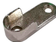
Tapa lateral ECOX-CLIP-M5 Side cap