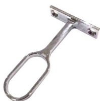
Soporte de sujeción ECOX-CLIP-M6 Fixing clip